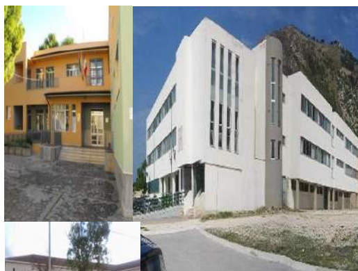
Scuola Primaria e Infanzia Plesso G. Paolo II

Scuola Secondaria di Primo grado ad indirizzo musicale