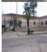
Scuola Primaria e Infanzia Plesso Napola